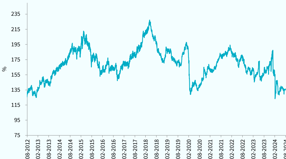
— TCM Africa High Dividend Equity